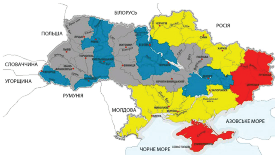
Рисунок 1. Уровни террористических угроз в Украине [4, с.414]

Исходя из вышеизложенного, можно отметить, что в Украине есть проблема угроз терроризма, первопричины которой следует искать в политической, экономической, социальной сферах.